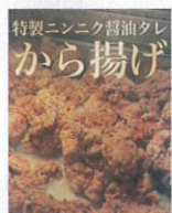
特製ニンニク醤油タレから揚げ